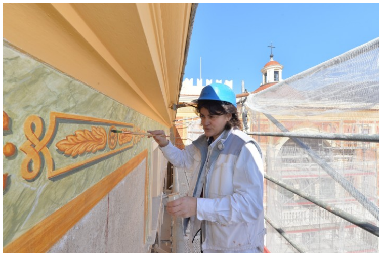
C'est dans ces cadres que seront reproduits à l'identique les tableaux d'origine et avec les techniques d'époque.

Le travail engagé est de la restitution, pas de la restauration. La différence entre les deux ? La restauration consiste, à partir de l'existant, à mettre à jour et nettoyer dans un souci de conservation.