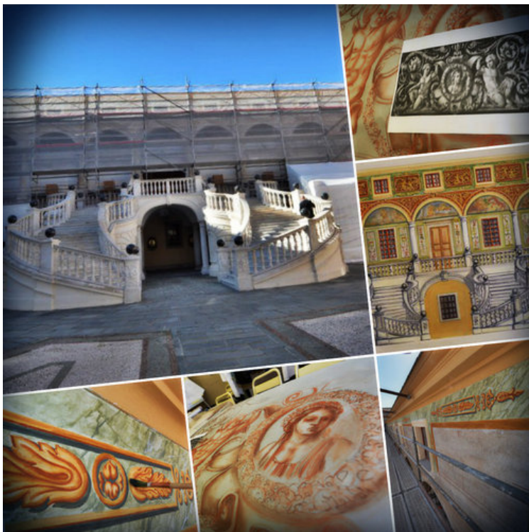
Les fresques du Palais princier bientôt remises à l'identique