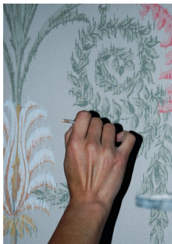
Hôtel de Tondutti