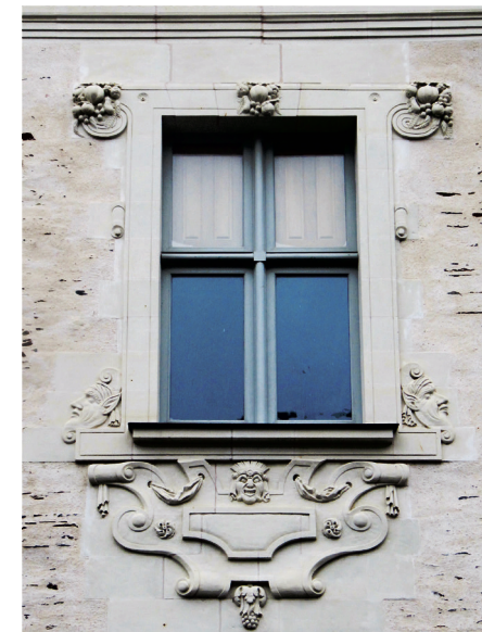
Hôtel Duguesclin, 1554, Angers